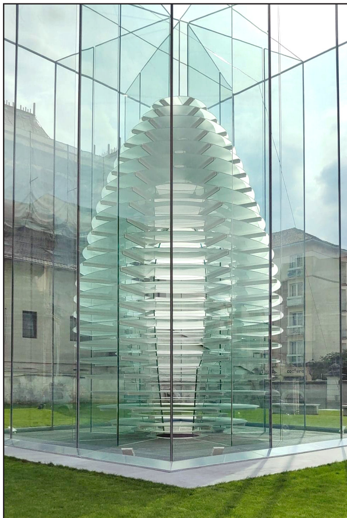
Prisma de sticlă, parte a Centrului „Constantin Brâncuși”